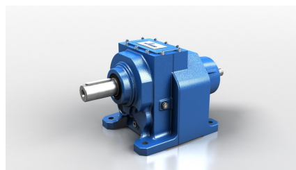
Чугунный цилиндрический редуктор IN 060

Тип: соосный Ступени: одноступенчатый, двухступенчатый, трехступенчатый Монтаж: горизонтальный, вертикальный